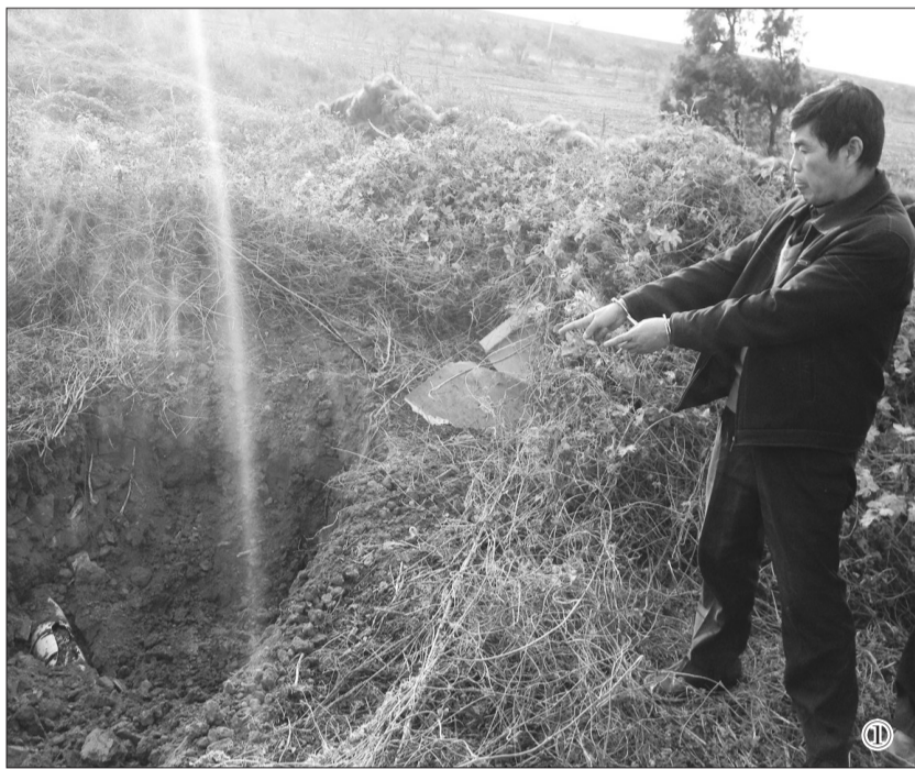
①犯罪嫌疑人现场指认暗管 ②侦查人员在现场排查并开挖暗管 ③发现直通长江的暗管