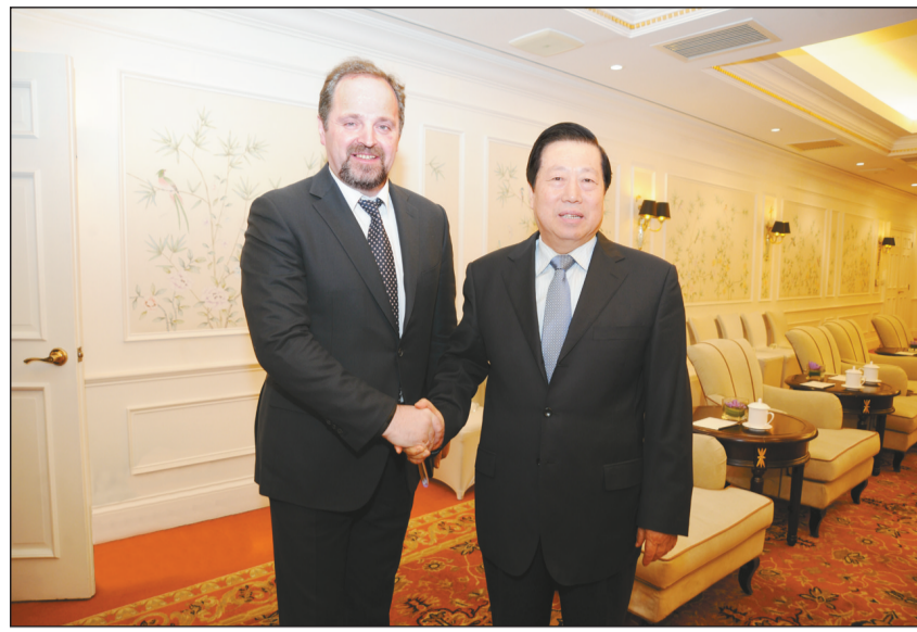
1月26日,环境保护部部长周生贤在京会见俄罗斯自然资源与生态部部长谢尔盖·东斯科伊一行,双方就共同关心的环境问题交换了意见。

本报见习记者吕望舒1月26日北京报道 环境保护部部长周生贤今日在北京会见了俄罗斯自然资源与生态部部长谢尔盖·东斯科伊,双方就共同关心的环境问题和金砖国家环保合作交换了意见。 周生贤首先代表环境保护部对谢尔盖·东斯科伊访华表示欢迎,并简要介绍了我国环境保护工作的最新进展。他说,当前,中国经济发展进入增长速度由高速转为中高速,经济结构由中低端迈向中高端,发展动力由要素驱动、投资驱动转向创新驱动的新常态,生态文明建设和环境保护也随之出现