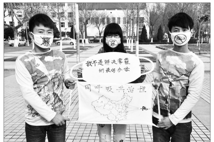
山东聊城大学的大学生环保志愿者日前戴上标有拒绝雾霾、拒绝PM 2.5 标识的口罩,手举巨型口罩,向人们倡导低碳生活,保护环境。

在对湖南经阁投资控股集团有限公司望城坡厂区进行检查时,岳麓区环保局负责人要求企业在坚决落实此前区环保局下达的督办函要求的基础上,进一步健全相关管理制度和档案台账,尽快实施厂区的整体搬迁退出,还周边群众一片良好环境。