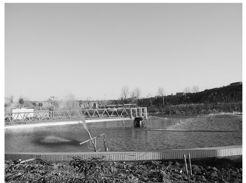
咸阳市加快污水处理厂建设,目前污水处理能力达到70万吨/日。图为运行中的咸阳三原污水处理厂。