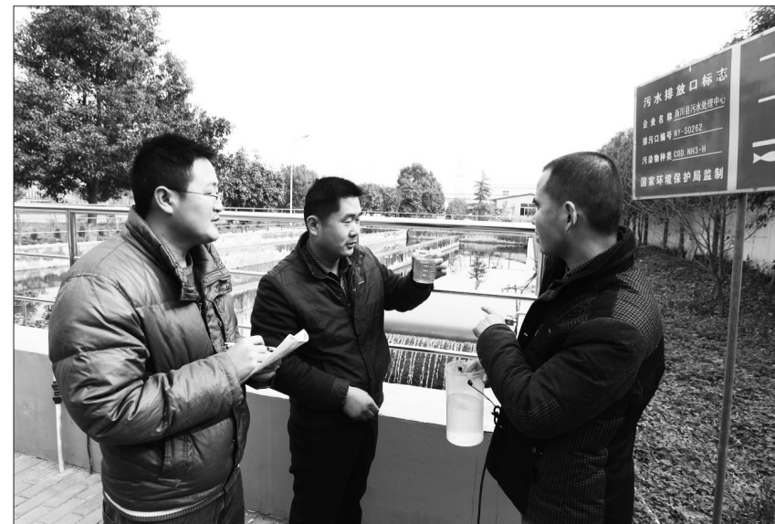
河南省南阳市对违反产业政策和违规建设项目,坚决实行环保“一票否决”。目前,南水北调中线汇水区区域内已经消除了造纸、酿造、化工等重污染排水企业。图为西峡县环境监察大队工作人员检查污水处理厂运行情况。