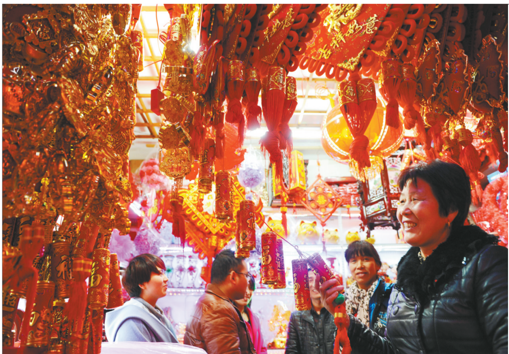
由于市民对烟花爆竹燃放带来的空气、噪声污染反映日益强烈,今年春节,浙江省东阳市中心城区禁燃、禁放烟花爆竹,倡导环保过节。图为市民在选购电子鞭炮。