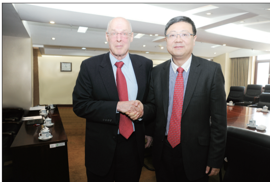
3月17日,环境保护部部长陈吉宁在京会见了美国前财政部长亨利·鲍尔森先生。双方就共同关心的环境问题和鲍尔森基金会在华环保项目等交换了意见。