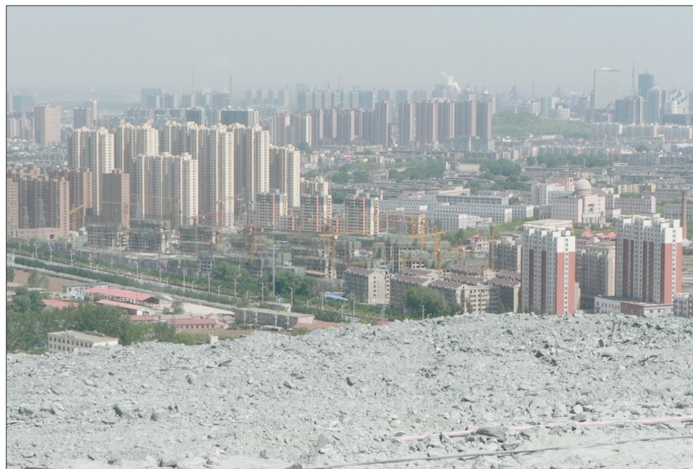
仅5年时间,鞍钢矿业公司东鞍山铁矿就在鞍山南部堆起一座高约200米的石质尾矿山。

鞍山宝得钢铁有限公司现场检查时发现,主要生产设施均无环保审批手续,从2002年陆续建设投产一直违法生产至今。