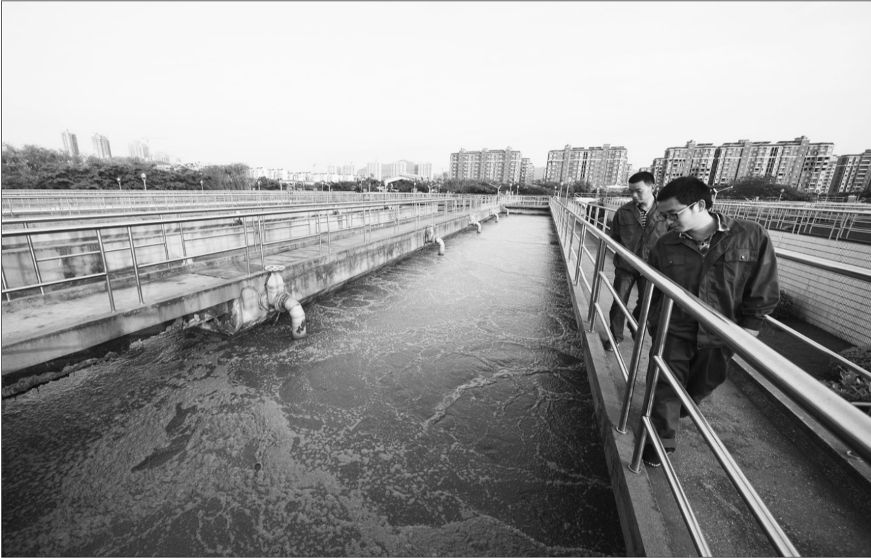
近年来,安徽省铜陵市加大污水处理厂建设力度,先后建成新民、西湖污水处理厂。目前,铜陵市城镇生活污水集中处理率达到90%,每天有13万多吨的生活污水经过净化处理后,实现达标排放。图为安徽铜陵新民污水处理厂工作人员在巡查净化池工作状况。