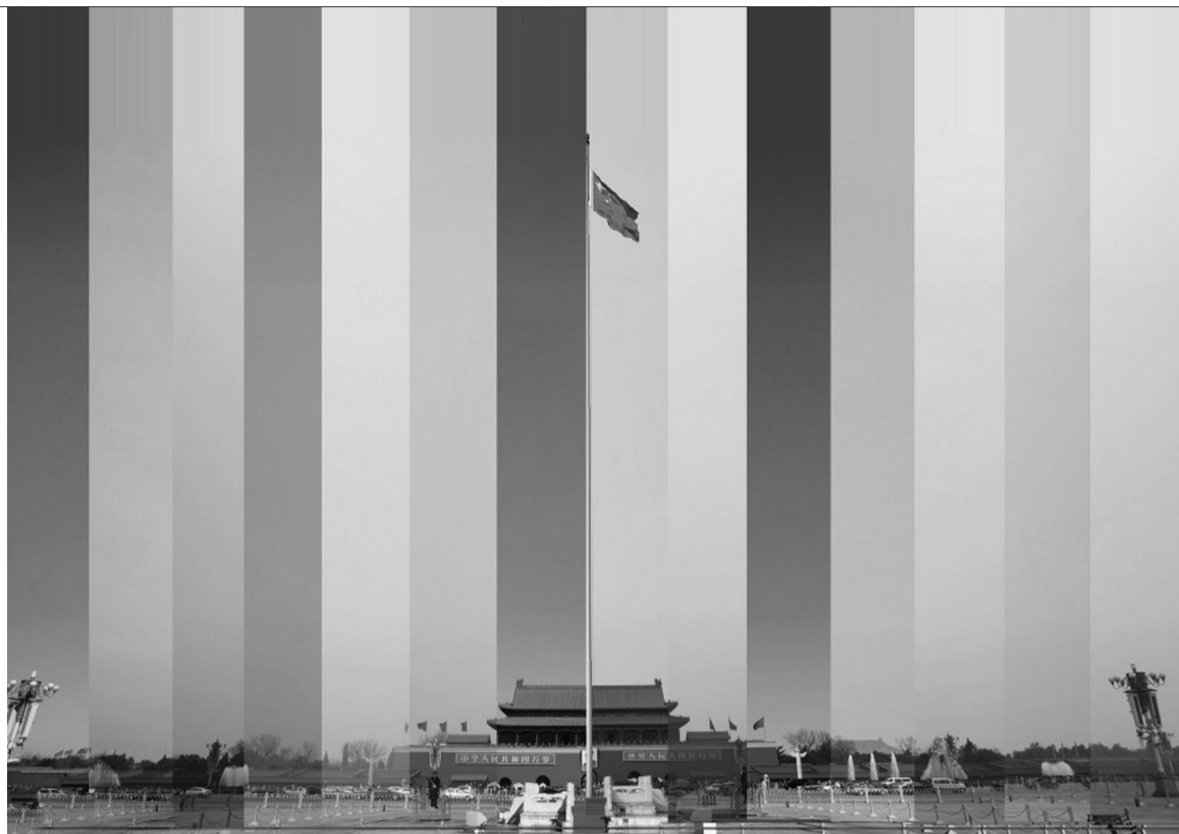
2013年全国“两会”期间,北京的雾霾让人印象深刻,记者用连续多天的影像记录下这一切。