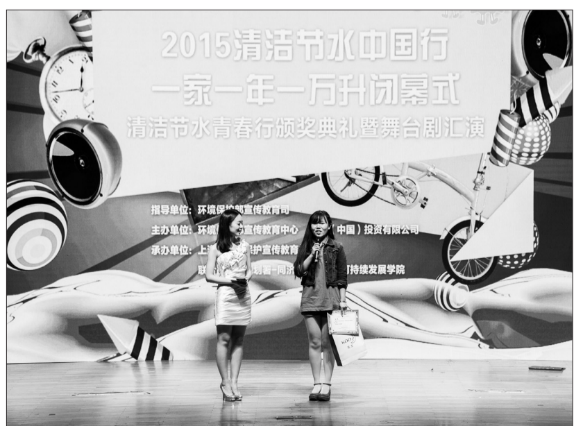
图为“清洁节水中国行,一家一年一升”闭幕式现场。