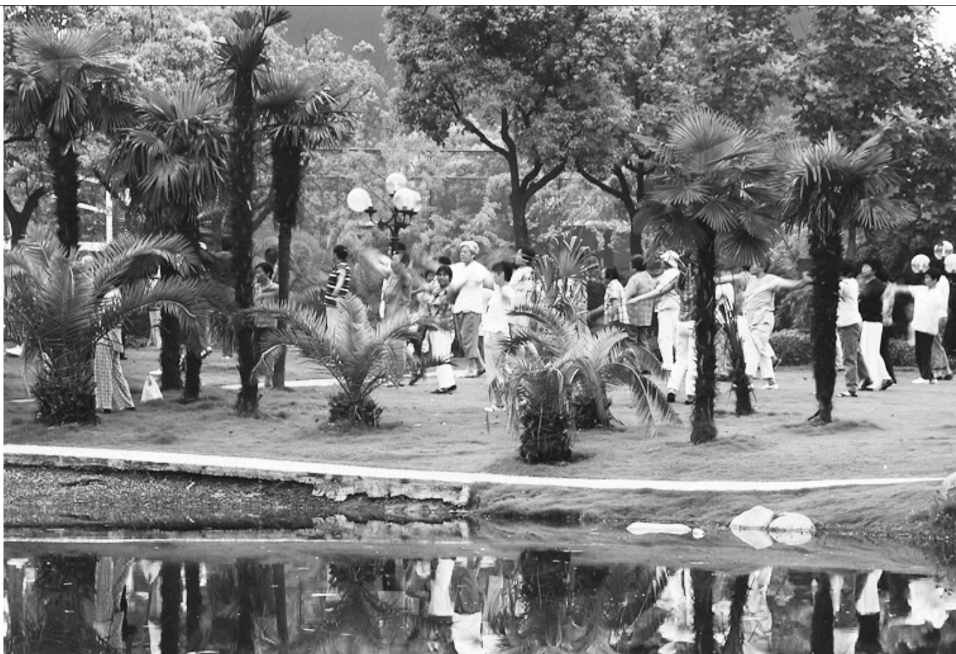
环境好了,市民们在绿树成荫的公园里呼吸新鲜空气边做运动。