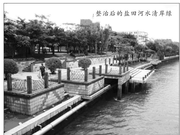
整治后的盐田河水清岸绿

盐田“天生丽质”的自然禀赋和盐田人一贯如一的生态保护努力,使得盐田在全市生态文明考核中占据优势,但能连续4年夺得全市考核第一,盐田更重要的是靠制度创新的发力,盐田的多项创新性保护举措,让盐田人在这片宜居的热土上享受宜居美好的生活。