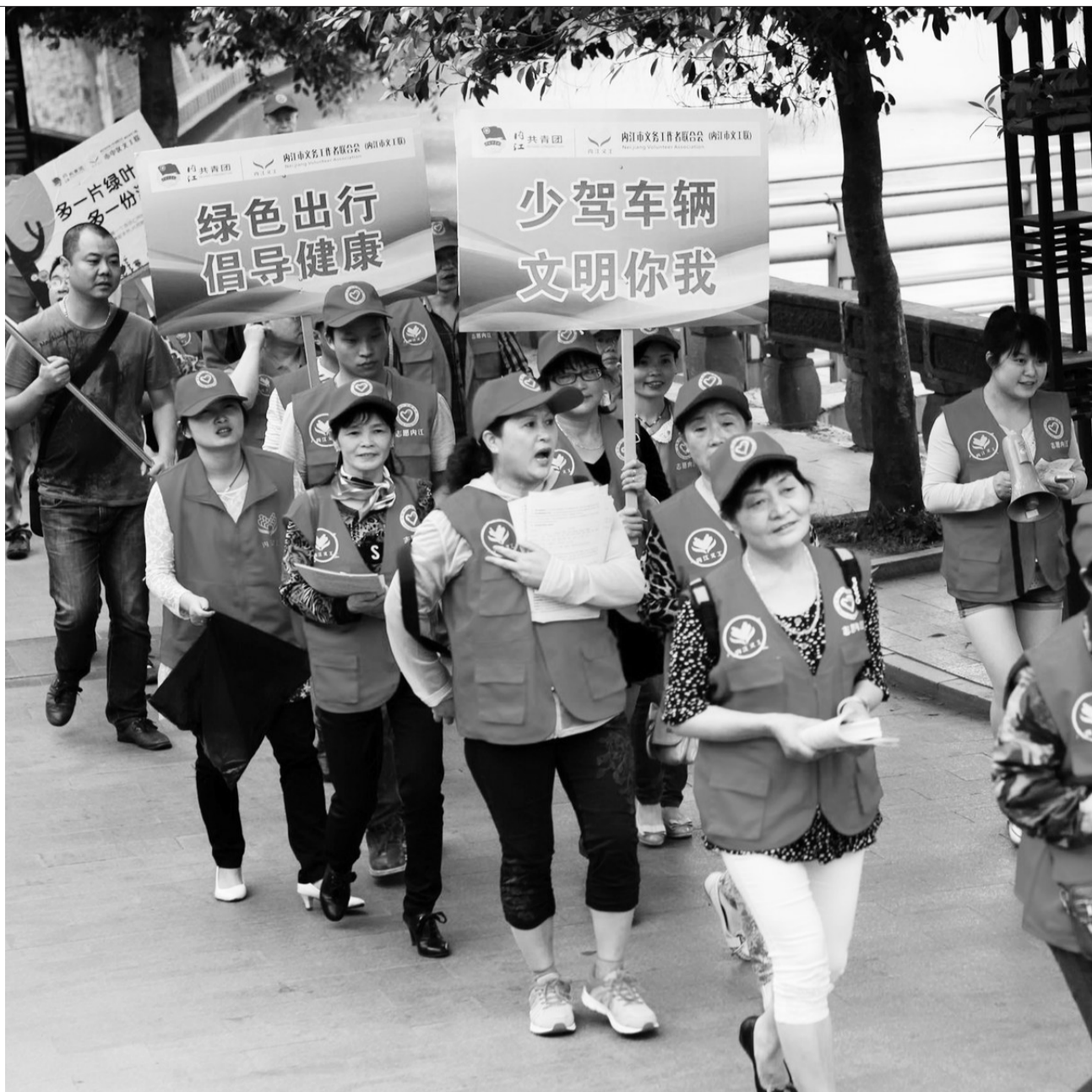
四川省内江市环保局等部门近日组织志愿者开展“健康徒步,爱我家园”主题宣传活动,积极推广徒步运动,倡导健康低碳的绿色出行方式,呼吁人们从身边小事做起,爱护地球。

这种全新的公众参与环保形式更加容易被政府、企业等环境管理和治理实施者接受,让问题在社会层面有被讨论的机会,让公共利益能够在更加稳定、和谐的社会氛围中得到实现。