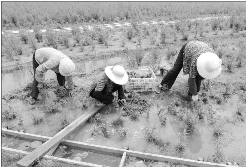
月牙岛位于江苏省连云港市海州区北郊,原是一个环境恶劣的湿地荒岛。海州区近来对月牙岛进行保护性整治开发,突出水绿文化、生态文化、滨河文化和原生态湿地风貌,使其成为市民家门口的湿地公园。图为工作人员在补种花草。