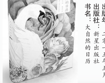
出版年:二零一五年五月 出版社:新星出版社 书名:大自然的日历

和《大地的眼睛》。除《恶老头的锁链》以外,其他4卷几乎片刻都没有离开森林的天地。即使《恶老头的锁链》,这部普里什文委婉吐露自身经历与心声的自传体哲理长篇小说,也富有不断挣脱锁链、不断探索内心自然路径的“层林尽染”之感。