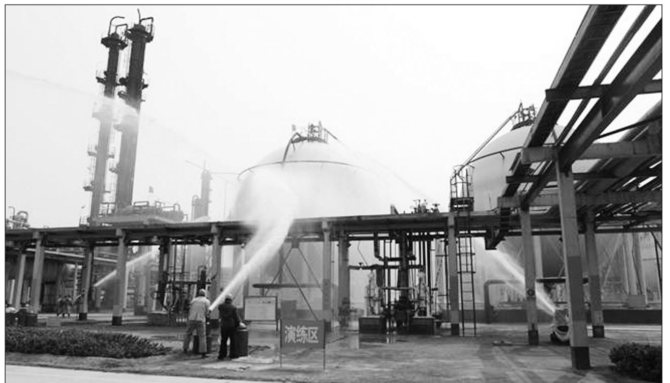
山东省淄博市日前组织开展气体泄漏事故应急演练,提升环保部门及企业突发环境事件应急处置能力,检验突发环境事件应急预案实用性、操作性。图为演练现场。

据专家介绍,“上半年雨水较往年增加是外因,内因还是对本地污染源的管控加大,效果明显。”上半年公布的PM 2.5 源解析也显示,南京作为重工业城市耗煤量惊人,对PM 2.5 贡献属第一;在产业格局转型速度有限的背景下,多雾上半年有利的气象条件,加上春节期间全面禁放、半年来持续的扬尘污染控制、工业排放的强力治理,给南京PM 2.5 浓度大幅下降“加分”。