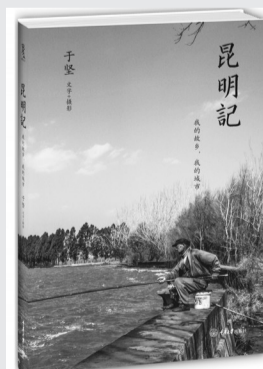
《昆明记:我的故乡,我的城市》作者:于坚 出版社:重庆大学出版社 出版时间:2015年6月

这是一幅失落的乡土中国缩影,一条流淌着近600年往事的时光之河。《匠人》讲述了作者的家乡——申村中,一个个手工艺匠人及其家族的命运故事,包括花匠、雕匠、铁匠、裁衣匠等。书中有正在凋零的乡村,有渐渐失传的手艺,也有匠人们正在一点点被遗忘的命运传奇。他们原是从古至今代代延续的链条,这个环,到今天,断了。我们将成为流浪在城市里的孤儿。