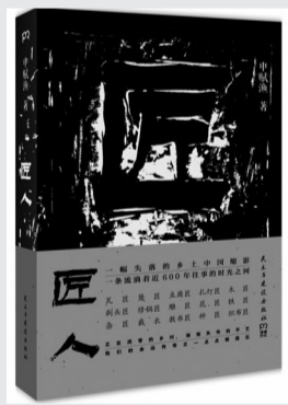
《匠人》作者:中赋渔 出版社:民主与建设出版社 出版时间:2015年7月

这是一幅失落的乡土中国缩影,一条流淌着近600年往事的时光之河。《匠人》讲述了作者的家乡——申村中,一个个手工艺匠人及其家族的命运故事,包括花匠、雕匠、铁匠、裁衣匠等。书中有正在凋零的乡村,有渐渐失传的手艺,也有匠人们正在一点点被遗忘的命运传奇。他们原是从古至今代代延续的链条,这个环,到今天,断了。我们将成为流浪在城市里的孤儿。