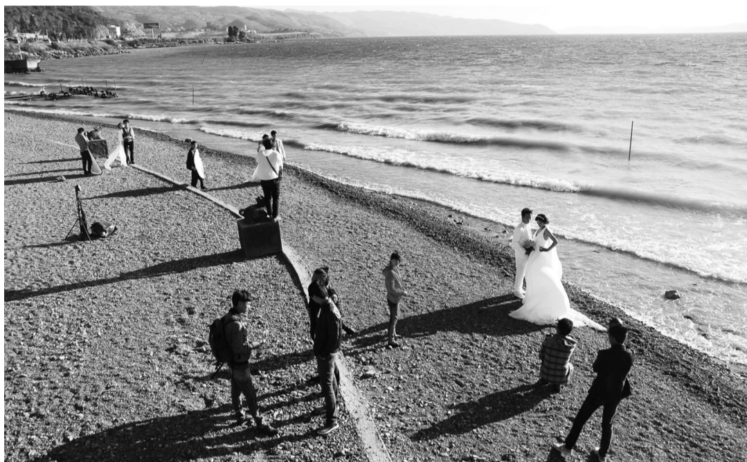
抚仙湖位于云南省玉溪市,美丽迷人,令国内外游客流连忘返。图为对对新人在湖畔留下温馨浪漫的记忆。

玉溪市严格落实河段长负责制,与沿湖澄江县、江川县、华宁县联合开展一级保护区不文明行为专项整治,不断加强综合行政执法、环境卫生、水政渔政和