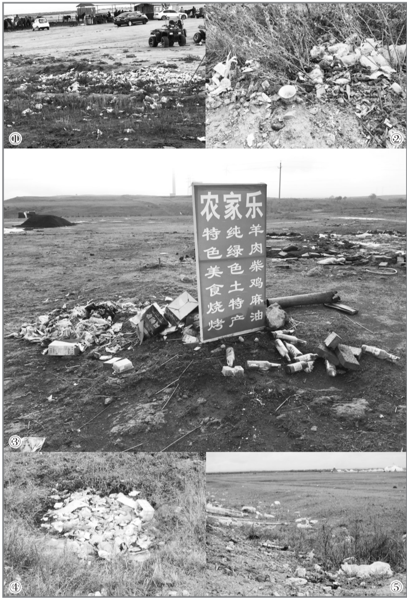
①中都草原一牧民娱乐场周边两堆垃圾之一。②喇嘛山释佛云山风景区门口河边垃圾成堆。③草原天路东线断崖观景台上,一农家乐撤走后留下的垃圾。④京北第一草原游客中心处,停车场铁栏杆外的垃圾坑。⑤草原音乐节跑马场上留下的垃圾。

同时,乌恩表示,在目前国情下,各个景区首要的任务还是建立完善有效的垃圾收集、清运制度。黄金周、寒暑假、周末假日时,应该对可能出现的垃圾问题有预见,并通过增加设施、加派人手、提高转运速度等方式,避免垃圾堆积如山、游客随意丢弃现象。