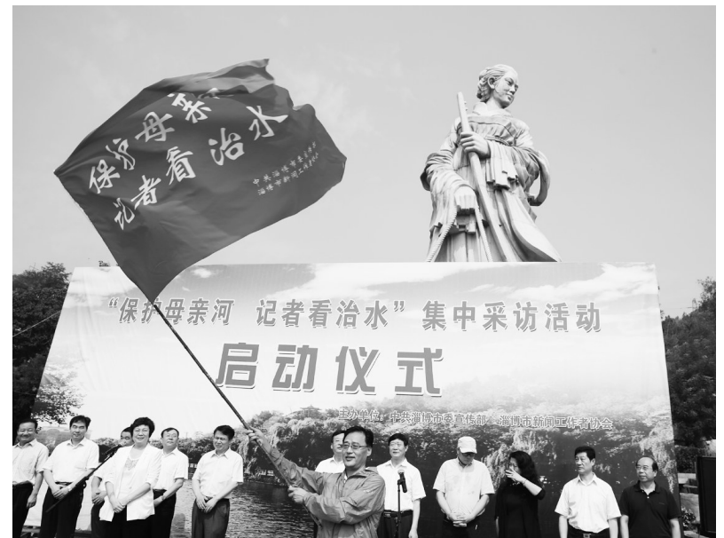
为让公众更好地了解孝妇河治理进展,淄博市启动了“保护母亲河记者看治水”集中采访活动。图为活动启动仪式现场。