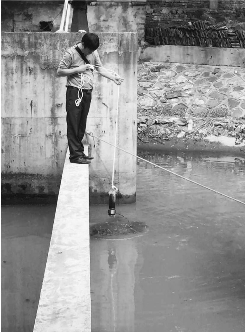
图为一位莫愁河长在取水样。

此后,养鱼人每次试图投放粪便都会有人当面制止。养鱼人就奇怪地问:“你们怎么知道我啥时候喂鱼的。”周边居民回答:“我们就在楼上用高倍望远镜盯着你呢。那么多双眼睛,你投放的时间规律,我们一下就摸清