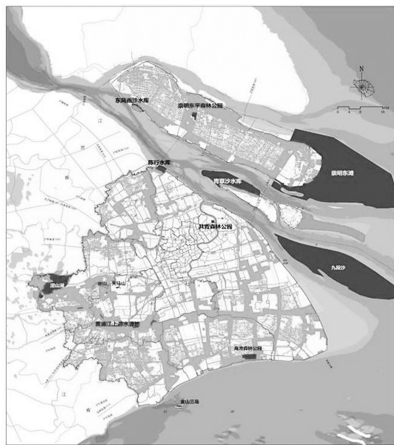
图例 一级保护区 二级保护区