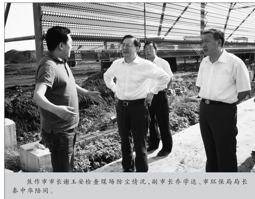
焦作市市长谢玉安检查煤场防尘情况,副市长乔学达、市环保局局长秦中华陪同。

建立网格管理机制。在解放区、山阳区、中站区、马村区、市城乡一体化示范区39个乡镇325个村(社区)任命了364名环保网格员,对露天有烟烧烤、燃煤锅炉、餐饮门店油烟污染、垃圾焚烧、交通扬尘等低空面源污染进行全天候、全方位、全过程、全时段、全覆盖监督。