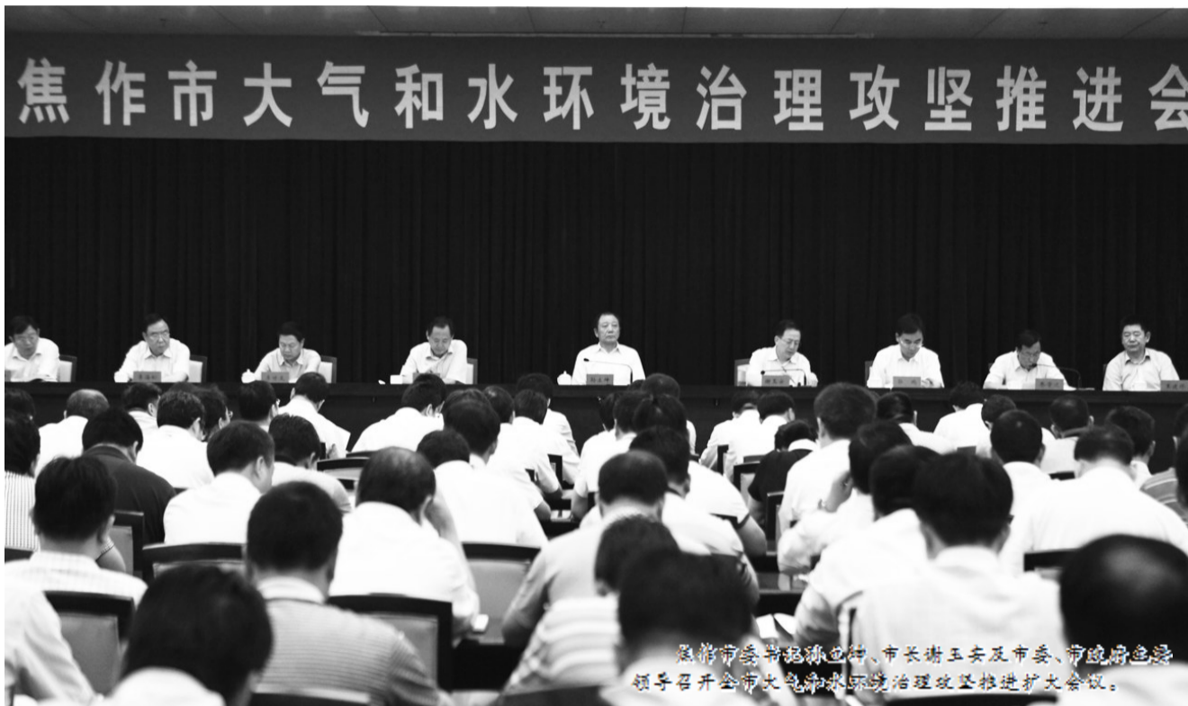
焦作市委、市政府挂帅,市长谢玉安及市委、市政府领导班子成员召开全市大气和水环境治理攻坚推进会。

焦作市委、市政府深刻认识到,保护环境既是重要的环保工作、重大的民生问题,更是经济转型升级的重要抓手、生态文明建设的重大举措,必须思想上高度重视,行动上强力推进;环境保护是一项社会系统工程,需上下联动、齐抓共管,全社会共同参与,并不断完善工作机制。