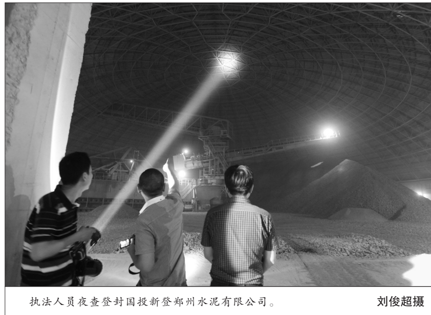
执法人员夜查登封国投新登郑州水泥有限公司。