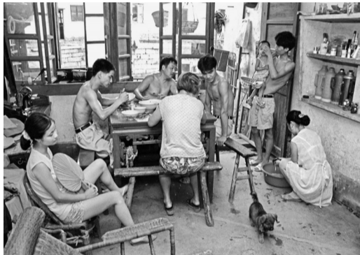
▲1994年,古镇生活悠然,民风古朴。