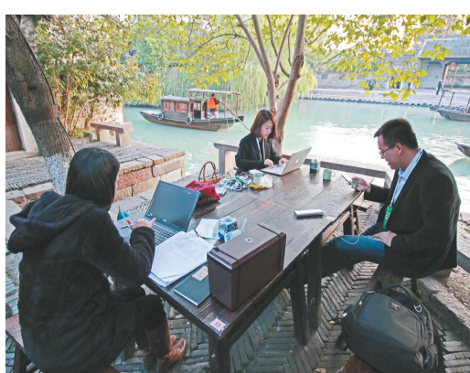
▲2015年,水乡古镇充满智慧元素。