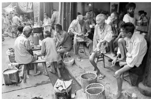
▲1990年,茶客边聊天边喝茶。