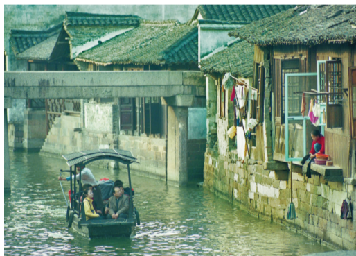
▲2002年,乌镇景区改造后,陆续对外开放。