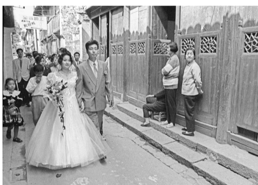
▲1995年,年轻人把穿西式婚纱的时尚带入乌镇。