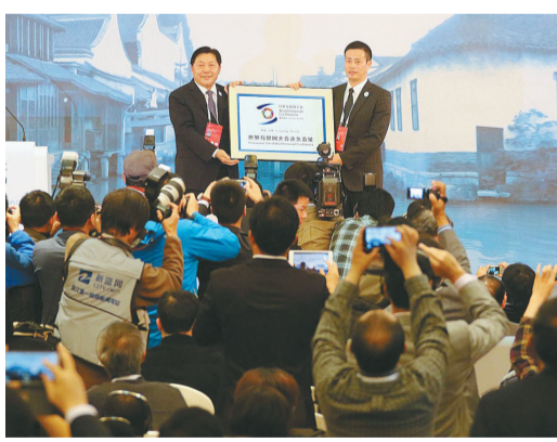
▲2014年,乌镇被授予“世界互联网大会永久会址”。