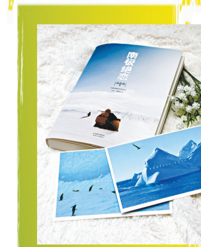
《南极绝恋》 作者:吴有音著 出版社:天津人民出版社 出版时间:2014年5月

连奕亏尼深度脱水设备 诚聘代理/经销商 上海中耀环保 13816865016 13524069775 13801764423