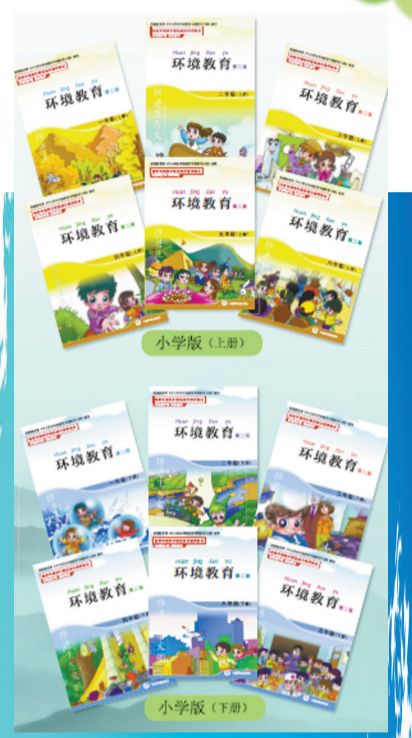
《环境教育》 作者:环境保护部组织编写 出版社:中国环境出版社 出版时间:2015年7月

中国第29次南极考察队长城站站长俞勇评价说,《南极绝恋》向我们展示了人的心灵如何在壮美自然的锤炼下闪现人性光辉。在南极,这种生命的坚强和爱情的美好,成为一种极致。