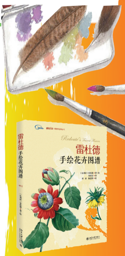
《雷杜德手绘花卉图谱》 作者:雷杜德著 出版社:北京大学出版社 出版时间:2016年1月