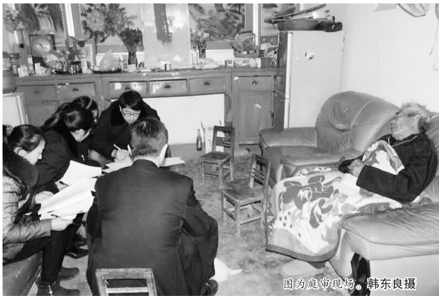
图为庭审现场。

12月12日,法官叶春花与陪审员、书记员、公诉人等人来到被告人郭某家开庭。庭审过程中,被告人的亲友及周边乡村的村民也赶来旁听。