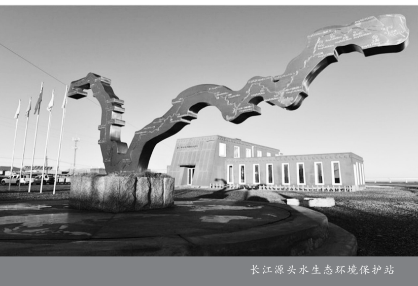
长江源头水生态环境保护站

雪簇簇而下,天边只剩下几朵云。屋外不到十米处,沱沱河冻成了冰。天却干燥得很,风从遥远的草原深处刮来,裹着裸露于地面的沙尘而起,以每秒数米乃至数十米的速度上下左右奔腾,空气中的水分似乎都被抽干,连氧气也仿佛被连带抽走。这里是万里长江第一镇唐古拉山镇,大寒已过,小镇进入了一年中最寒冷的时节。在这座海拔4516米的小镇,最特别的是位于镇东的一栋砖红色小屋,色彩鲜艳夺目,设计动感十足,一条长江龙的雕刻立在门前,栩栩如生。天刚蒙蒙亮,屋内就有人窸窸窣窣地起床、洗脸做饭,监测高原环境。零下约30摄氏度的天气,小镇上人烟稀少,游人和访客也止步于严寒。但仍有不少人,坚守在这座小屋里。在这个被称为长江源头水生态环境保护站的房子里,他们可能来自全国各地,但却有一个共同的称号——志愿者,他们服务的组织叫绿色江河。这是一个以志愿者为主维护日常工作与运行的组织。每年,都会有几十位甚至更多人从全国各地至此志愿