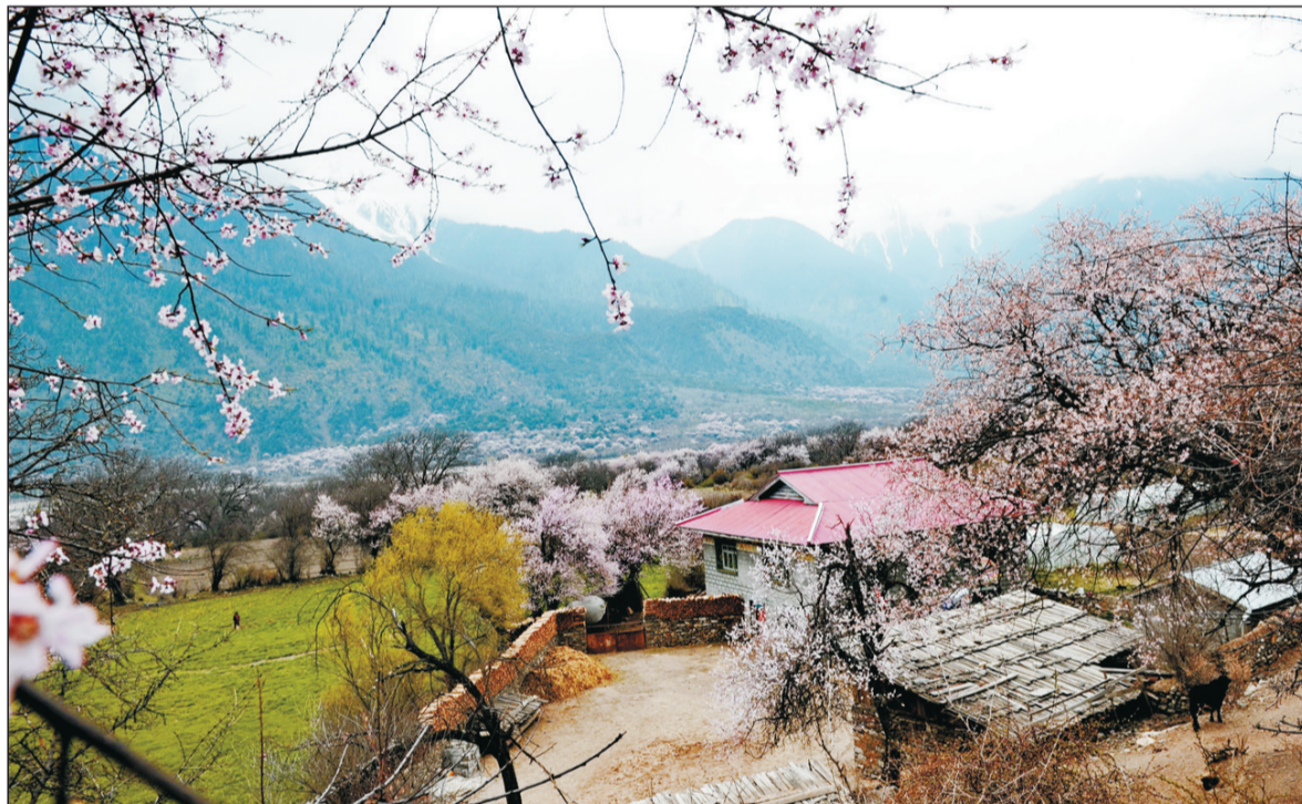
壮美冰川跃云端, 静好波密藏桃源。独特的区位优势加上优美的生态环境, 使3月的西藏自治区波密县春意盎然, 形成了“风景这边独好”的自然景观。

黄润秋表示, 环境保护部将一如既往地支持、配合全国人大环资委和中华环保世纪行组委会的各项宣传活动, 同时要求地方各级环保部门主动配合记者的采访, 为媒体宣传报道创造有利环境和条件。让我们各方携起手来, 共同为建设天蓝、地绿、水净的美丽家园作出贡献。