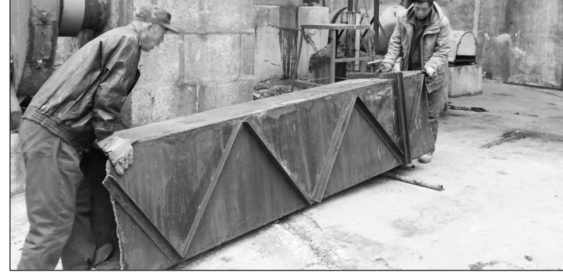
图为烟台市开发区现场拆除企业燃煤锅炉风道设施。