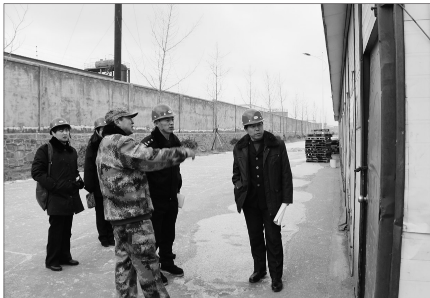
为进一步规范企业危险废物管理,烟台市环保局组织开展了集中排查整治非法排放、倾倒、处置危险废物违法犯罪行动。图为执法人员在企业开展现场检查。

2015年,烟台市环境空气质量优良天数为304天,同比增加24天,优良率为83.3%,同比增加6.6个百分点;“蓝天白云”天数达311天,同比增加9天,位居全省第二。水源地水质达标率达到100%。