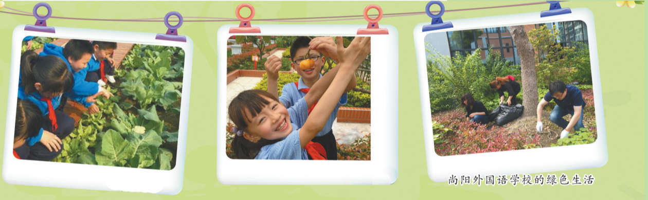
尚阳外国语学校的绿色生活

连续污泥深度脱水设备 诚聘代理/经销商 上海中耀环保 13816865016 13524069775 13801764423