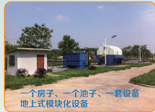
湖南省长沙县18个乡镇打捆项目