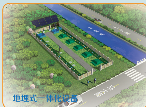
北京通州区马驹桥镇姚辛庄生活污水处理项目