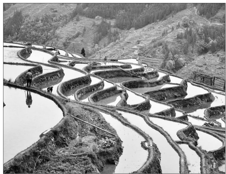
进入4月以来,贵州省从江县加梯梯田开始耕田注水,水面如镜的田块,线条分明的田埂,辛勤劳作的人们,构成一幅秀美的春耕图,如诗如画。