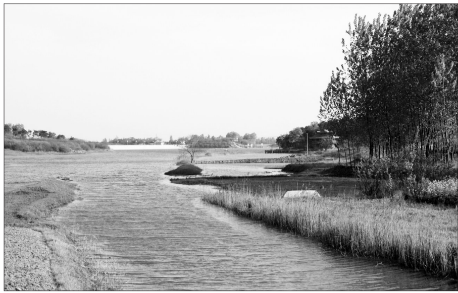
图为安徽省肥西县丰乐镇饮用水源保护地。