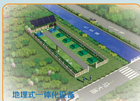
北京通州区马驹桥镇姚辛庄生活污水处理项目