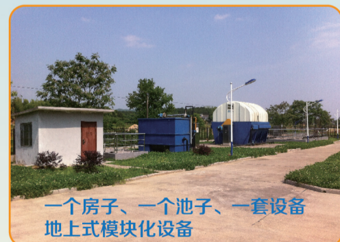
湖南省长沙县18个乡镇打捆项目