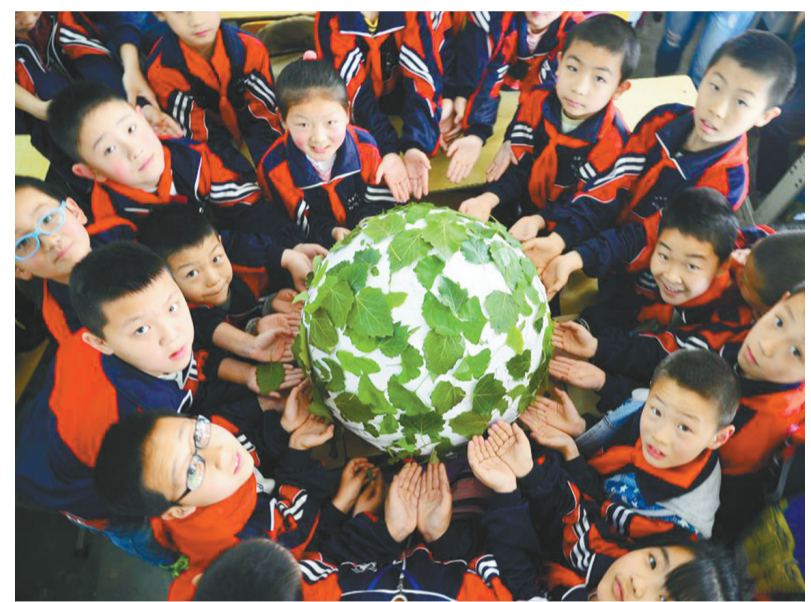
山东聊城大学大学生志愿者们近日来到聊城市开发区实验小学,举办了“善待地球,保护环境”主题活动。志愿者们向小学生讲解了地球相关知识,一起做地图游戏,并通过让小学生手托起自制的“绿色地球”方式,激发他们保护地球、爱护环境的热情。