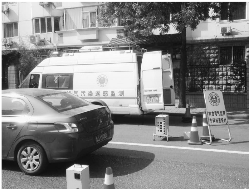
天津市不断加大机动车污染管控力度,推进空气质量持续改善。图为天津市环境监测部门在不同路段,实时遥感监测机动车尾气排放。

天津市环保局要求全市各区县环保部门进一步加强危险废物监管工作,组织辖区内危险废物经营单位、危险废物产生单位对照《危险废物规范化管理指标体系》,进行更深入的自查和整改,并按照《天津市环保局关于污染源日常环境监管随机抽查制度工作方案》要求,对危险废物经营单位、危险废物产生单位进行规范化检查和监管。