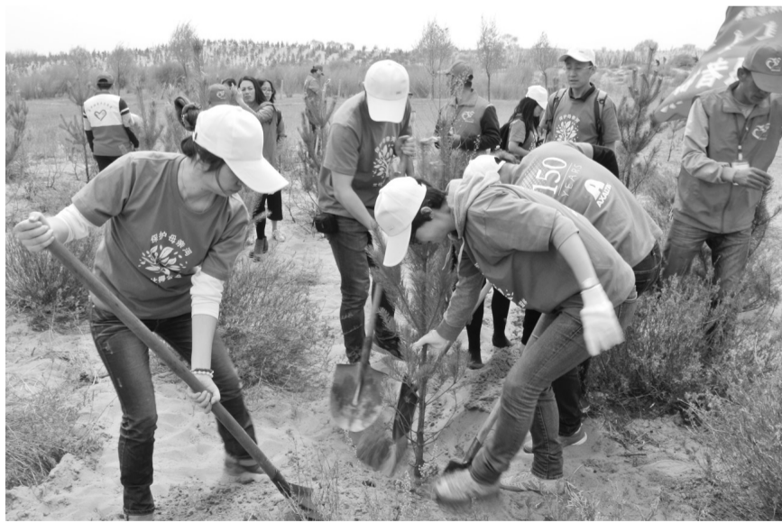
艾仕得涂料系统公司员工志愿者在内蒙古自治区乌审旗种植艾仕得林, 帮助当地抵御土壤被风蚀沙化, 扩大“绿肺”面积。

作为一家总部在美国的涂料制造跨国公司, 绿色理念已融入生产的每一个环节。这家公司所有的生产设施均已获得ISO14001环境管理体系认证证书, 以实现可持续和负责任生产。同时在产品和应用工艺层面, 艾仕得也长期致力于助力客户实现其可持续发展目标, 在确保高效和性能的