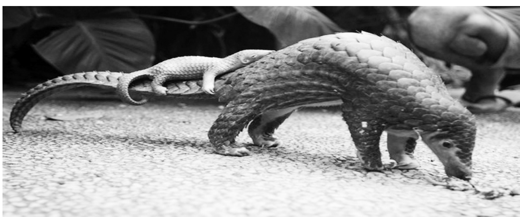
穿山甲, 顾名思义, 能“穿山”之“甲”, 以白蚁为食, 善打洞, 披鳞甲。现存穿山甲共有8个种, 其中, 分布在我国的是中华穿山甲和马来穿山甲。