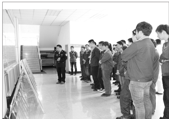
图为青岛高新区环保分局工作人员走进企业,现场进行环境法律方面的答疑解惑。