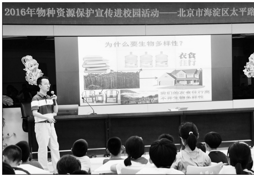
由环境保护部自然生态保护司指导、宣传教育中心主办的“2016年物种资源保护宣传进校园活动”日前在北京市海淀区太平路小学举行,1200余名师生参加了此次活动。活动以环保专家进课堂、现场互动、参观主题展览等形式,提升小学生对物种资源的认知与了解。

而这些人源中的氮氧化物和挥发性有机物在不同地方的比例又有所不同,即便在同一个城市,城区与郊区的比例也有差别。监管部门在日常监管的过程中,要把不同地方的臭氧形成机制搞清楚,通过监测摸清臭氧前体物的具体比例、排放源的位置,把握治理重点,真正做到“对症下药”。