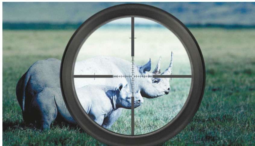
野生动物处境日益危险,图为草原上枪口瞄准下的野生犀牛。

国际犯罪集团也参与危险废物和化学品的走私,通常给这些废物贴上其他标签以逃避执法机构的审查。2013