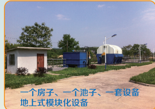
湖南省长沙县18个乡镇打捆项目