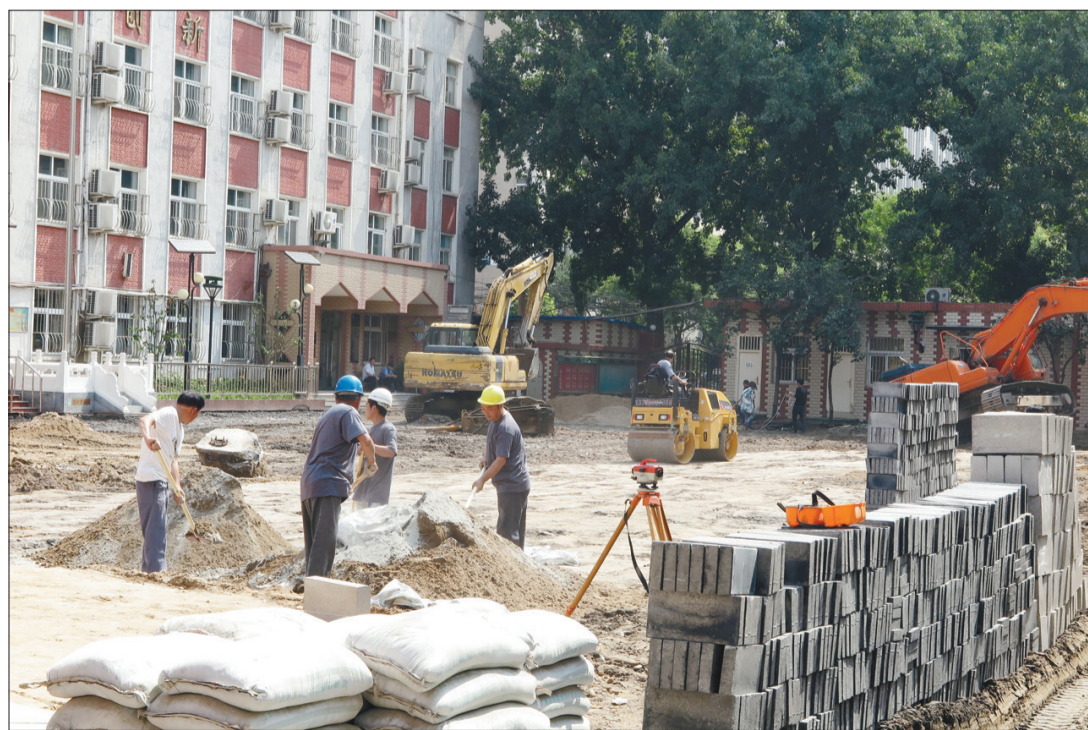
北京市西城区教委日前对实验二小白云路分校操场塑胶跑道进行拆除。此前该校多名孩子出现身体不适状况,塑胶跑道疑为罪魁祸首。据了解,西城区将继续开展调查,依法、严肃追究相关责任人的责任。

4月典型案例、1月~4月份调度情况区域分布表、4月份执行情况区域分布表详见今日二版