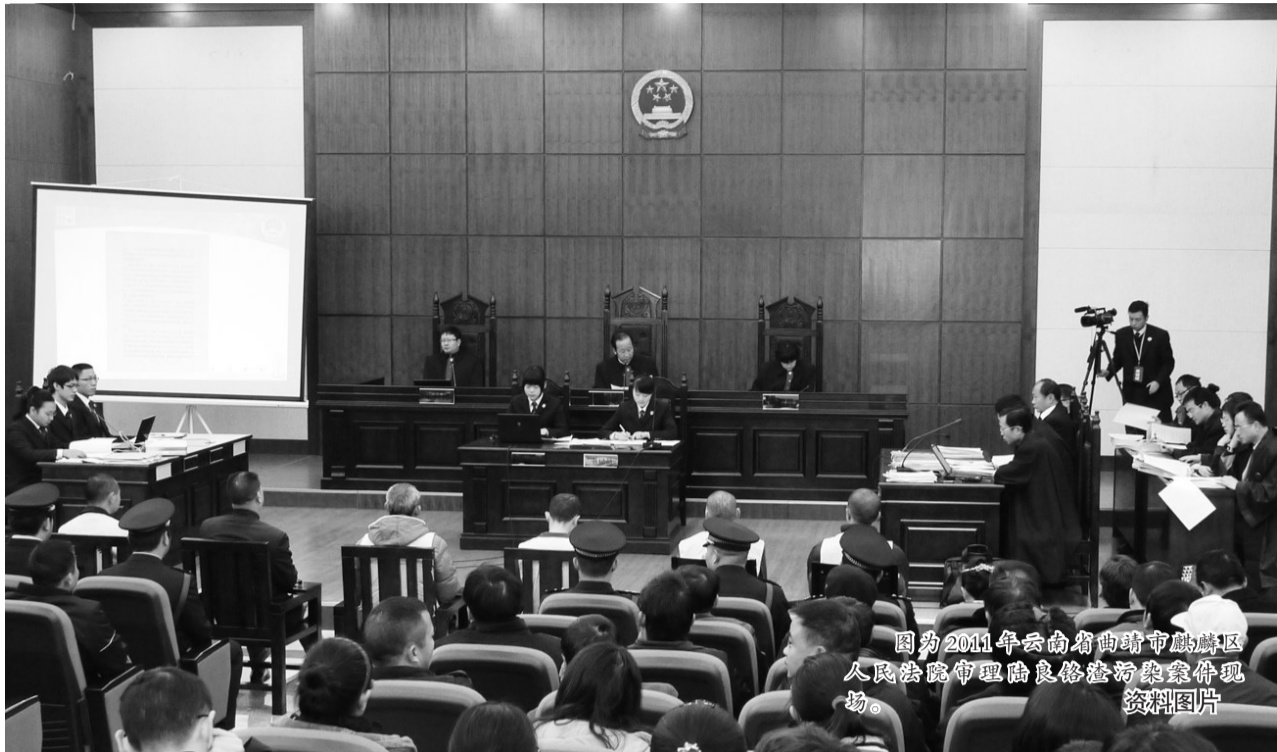
图为2011年云南省曲靖市麒麟区人民法院审理良修修污染案庭审现场。

据悉,崇明县人民法院环境资源审判庭将对与环境资源保护相关的刑事、民事、行政、执行等案件实行集中管辖、集中审理、集中执行,搭建环境资源司法保护的绿色通道。其主要职责包括受理污染环境、破坏资源、环