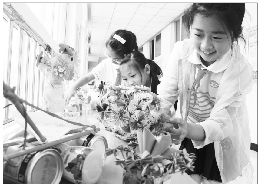
为营造校园低碳生活环境,打造学校生态特色,山东省威海市普陀路小学日前举行第三届生态节活动。图为同学们用废旧物品制作的环保手工艺品。

鱼粉尾气给环境带来的不良影响。 为推进燃煤锅炉整治,荣成市环保局采取安装脱硫脱硝设施、改用清洁能源和洁净煤、推广环保型锅炉等措施,推进现有生产经营性分散燃煤锅炉达标排放。力争到年底,全市至少完成单台10蒸吨/小时及以上燃煤锅炉超低排放改造任务的40%。 对于区域特点明显的地区,荣成市环保局将实施区域污染整治工程,预计年内完成人和片区首批23家石材企业整治,并结合人和镇的区域特点,加强对干制海产品晒场的整治工作,取缔加工小作坊和露天晒场。 在石岛城区实施集中供热供气工程,对集中供热工程辐射范围内的企业进行环境监管,逐步淘汰辐射范围内所有20蒸吨及以上的燃煤锅炉。 姜小蓉