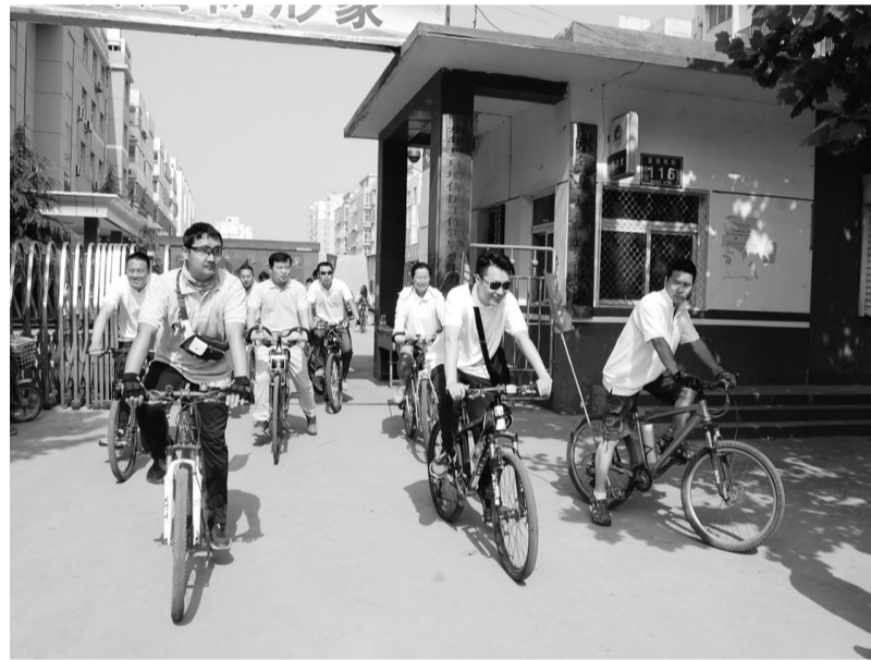
河北省永年县环保局近日组织50余名环保志愿者,开展以“倡导低碳出行,推动绿色发展”为主题的自行车骑行环保宣传活动。

绿色出行在三秦大地渐渐成为潮流,三秦人民正在用环保行动,让天更蓝,山更绿,水更清。