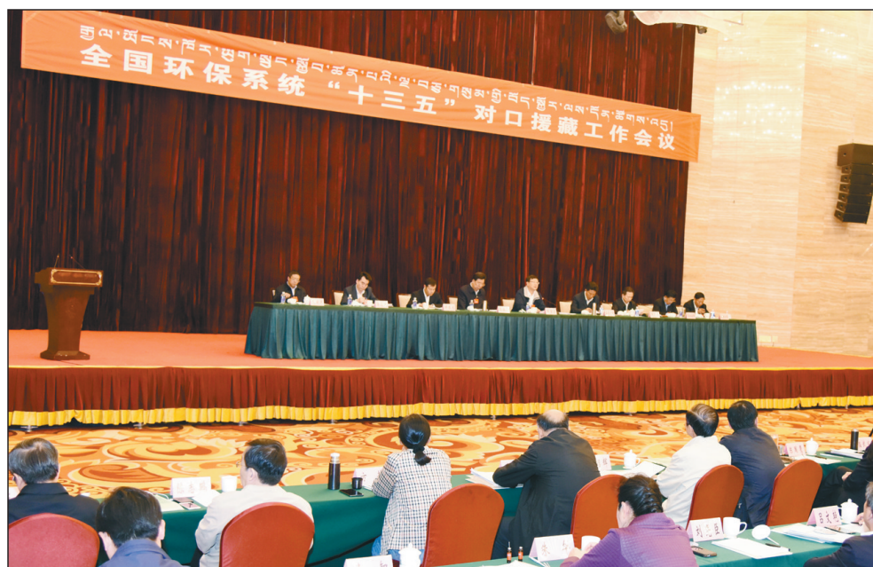
7月4日，环境保护部在西藏自治区拉萨市召开全国环保系统“十三五”对口援藏工作会议。环境保护部部长陈吉宁出席会议并讲话。

陈吉宁指出，“十三五”时期，是西藏与全国一道全面建成小康社会的决胜阶段，也是推进西藏绿色发展、加快构建国家生态安全屏障的关键时期。全国环保系统“十三五”对口援藏工作的总体思路是：全面贯彻党的十八大、十八届三中、四中、五中全会和中央第六次西藏工作座谈会精神，深入贯彻习近