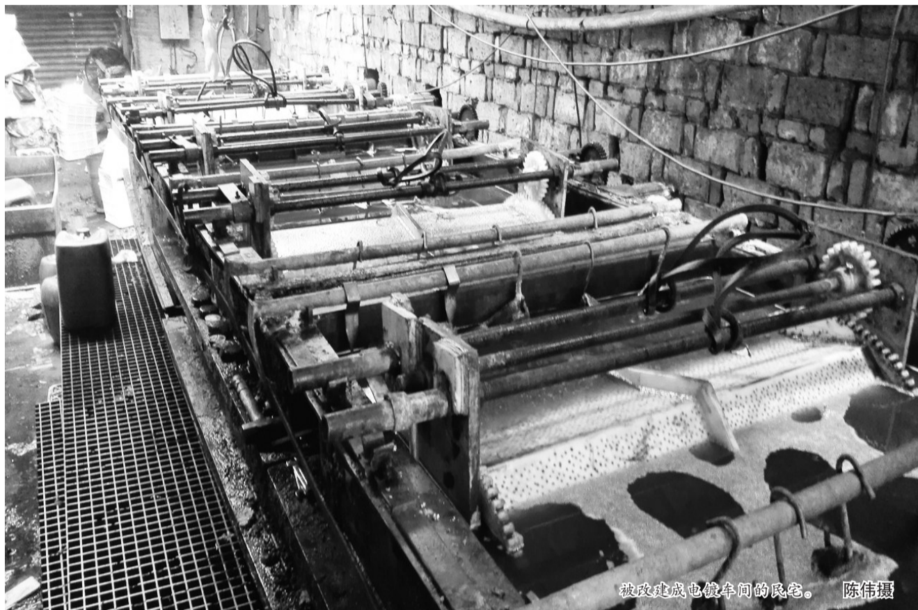
被改造成电镀车间的民宅。

前不久的一天下午,伴随着警笛声,一辆警车缓缓驶入浙江省台州市椒江区公安分局三甲派出所。