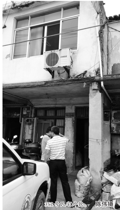
352号民宅外景。

三是公安介入模式,由公安机关协助调取户主信息并进行传唤,涉及环境污染刑事犯罪的,若户主和当事人均联系不上或不配合说明情况的,由户主作为第一当事人将案件移送,再由公安机关力量找到户主本人查清此案。