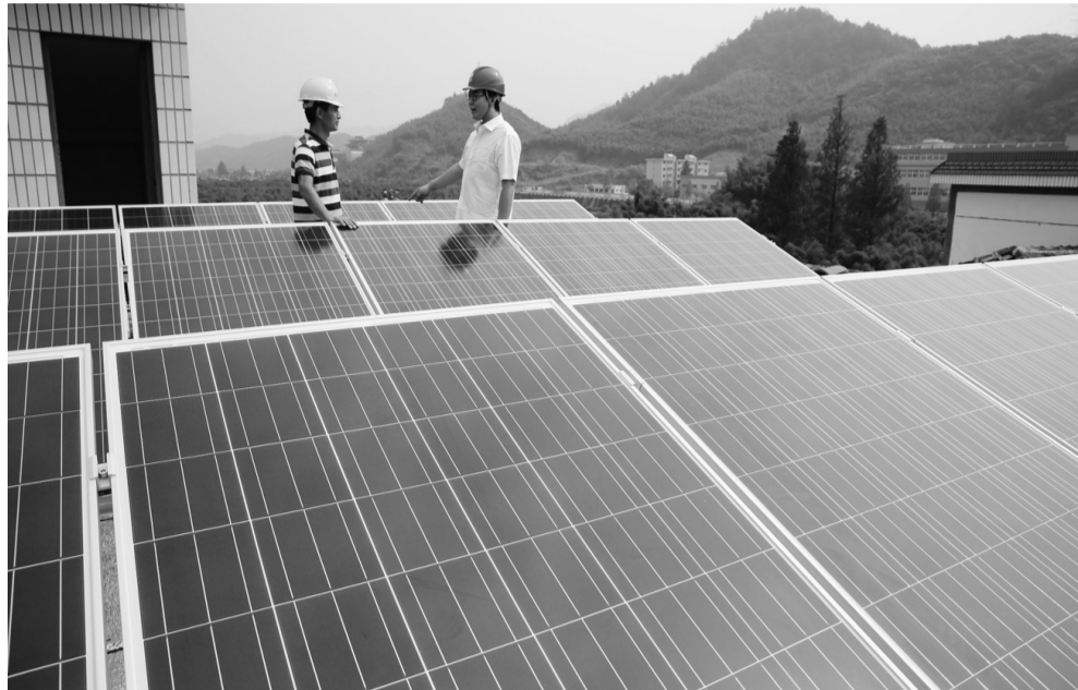
图为技术人员正在对屋顶安装的光伏设备进行检查。