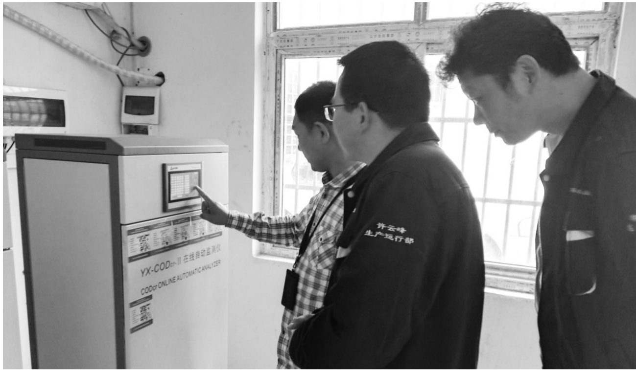
图为湖北省环境执法人员在荆州市某企业检查时,调阅污染源自动监控设备检测记录。