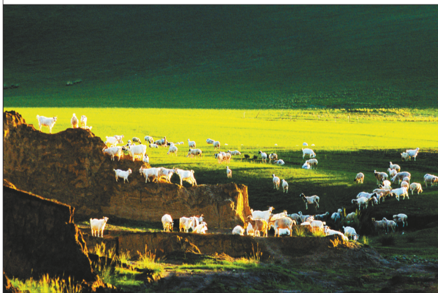
景色优美的乌拉特草原