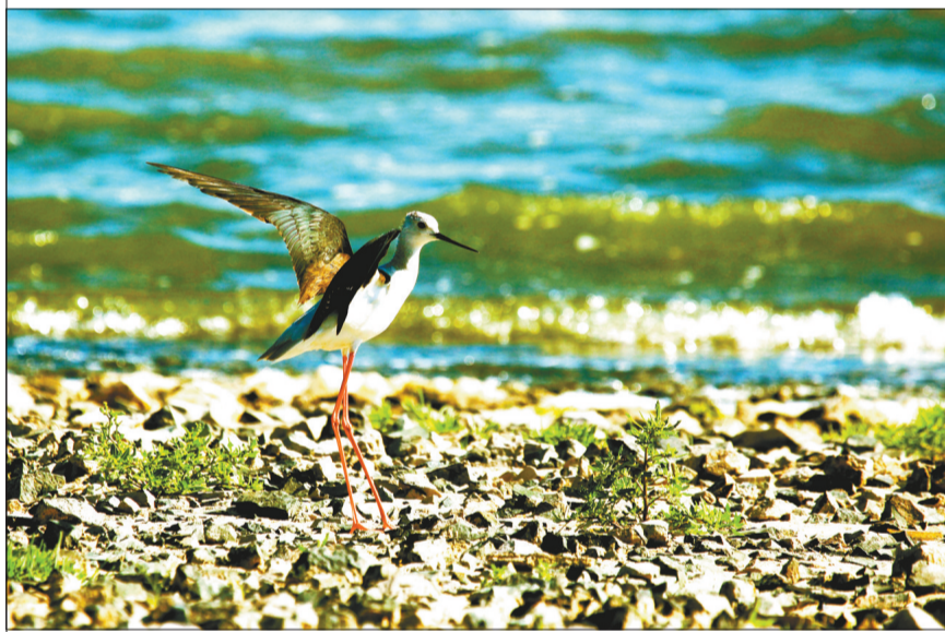
风景秀丽的达里诺尔湖