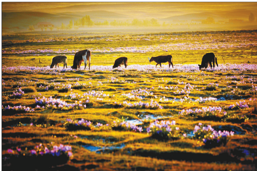
朝霞映照下的美丽草原

在政府职能部门工作职责中,明确了环境保护部门贯彻执行国家环境保护法律法规、参与编制主体功能区规划、对环境保护管理制度实施情况进行监督、依法查处各类环境违法行为等15条具体工作职责;发展和改革委员会7条工作职责;公安部门和科技行政部门各两条。同时,财政部门、国土资源部门、住房城乡建设、农牧业、林业、商务部门等36个政府职能部门列入名单,并且对每一个部门工作职责都进行了详细明确。