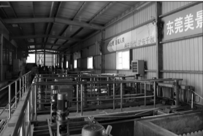
东莞美景电镀废水零排放项目现场。