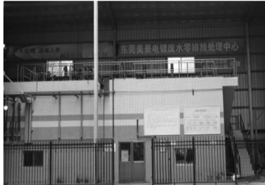
东莞美景电镀废水零排放处理中心。