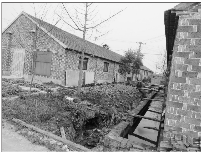
整改前,农户江姓猪舍养殖污染直排。

责编:王玮 电话:(010)67113382 传真:(010)67113772 E-mail:hjbslaw@sina.com