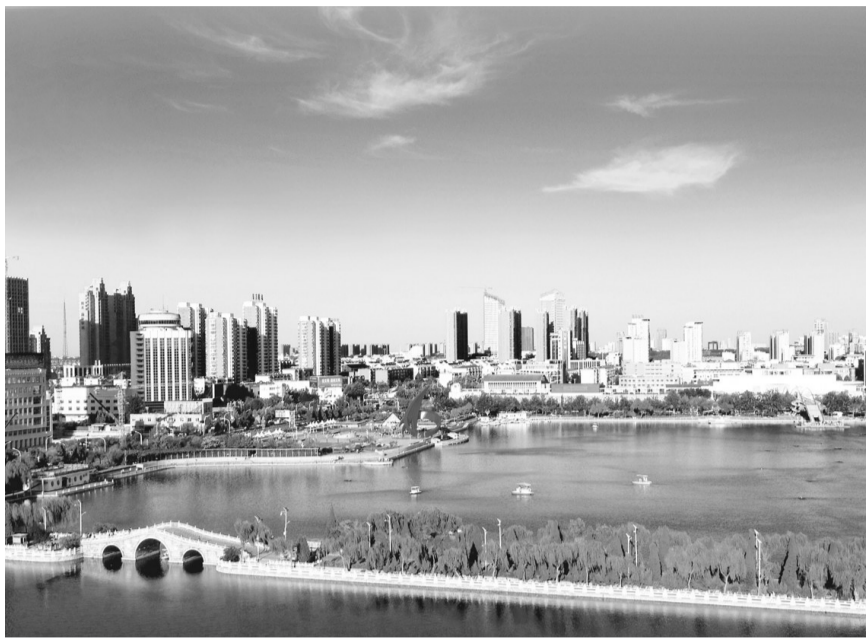
上半年,德州市大气环境质量同比改善,图为蓝天白云下的明月湖。

德州市保持环境执法的高压态势,不断加大执法力度,今年以来共出动环境监察人员11000余人(次),检查企业5500余家(次),行政处罚123起。深入推进行政执法与刑事司法衔接,环保、公安部门联合侦办环境刑事