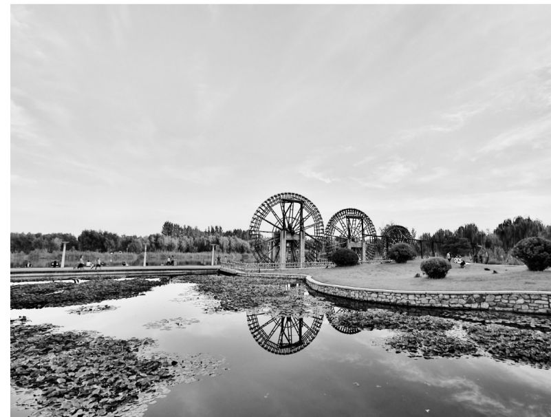
德州近年来深入贯彻“治用保”流域治污理念,主要河流水质稳定达到地表水V类标准。图为风景宜人的减河人工湿地。